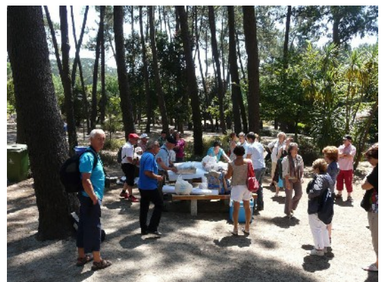
« Les Petits Cochons... »