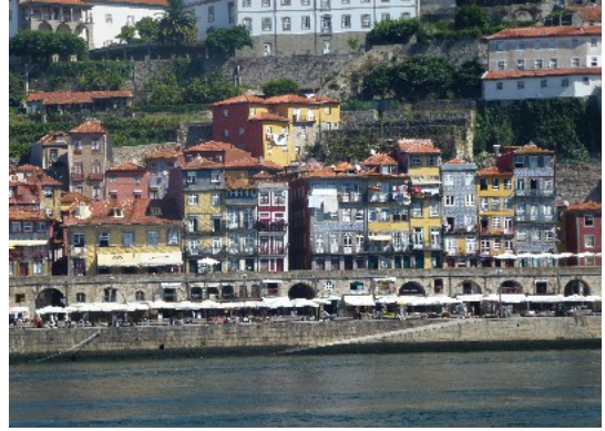
Porto vu des quais