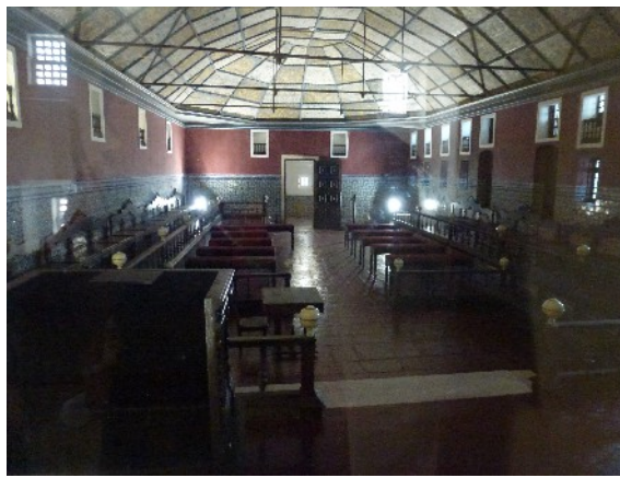
La salle des actes de l'Université de Coimbra représentée au « Portugal miniature »

Nous repartons vers Ançã à 17 H 40 pour arriver à 18 H 15. Guingoï s'isole alors pour une répétition jusqu'à 20 H 30, heure à laquelle les familles récupèrent leurs invités pour le dîner.