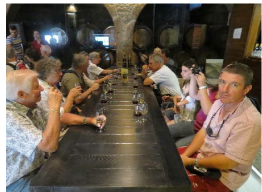
« La dégustation »