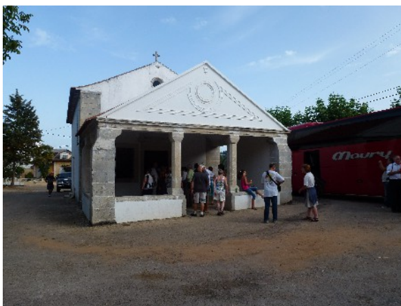
La Chapelle Saint Benoit