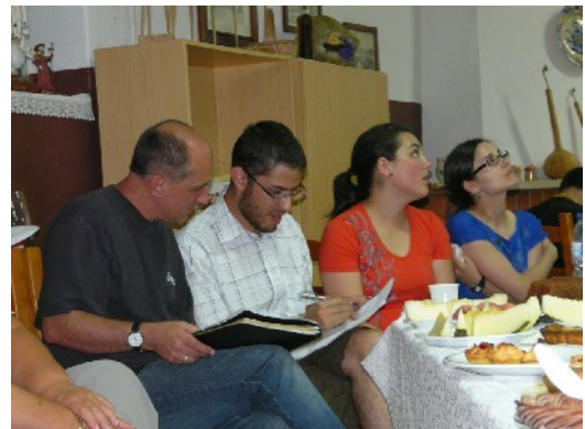
Répartition dans les familles