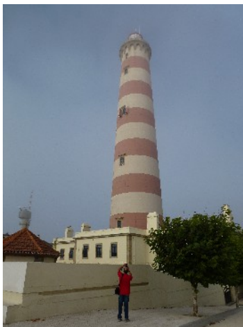
Farol de Barra