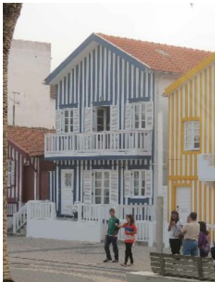
Baraques typiques du bord de mer