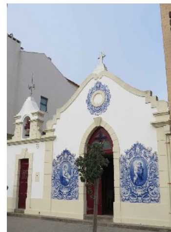
Petite Chapelle près du phare