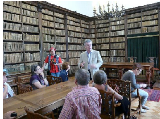
Accueil par le directeur de Coimbra dans la bibliothèque historique

Dans la salle des actes académiques (présentation des thèses), nous trouvons les portraits de tous les rois portugais, sauf 3 qui étaient aussi rois d'Espagne. Chaque année, environ 200 actes académiques sont présentés à Coimbra.