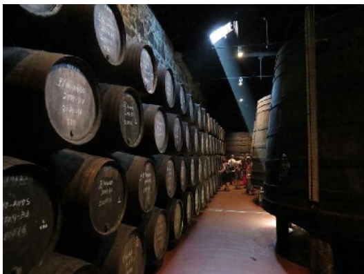
Les Caves de Porto

Après un arrêt « détente » d'un quart d'heure, nous arrivons sur les quais à 11 H. Tout le monde est d'accord pour une visite des caves et une dégustation du vin de Porto :