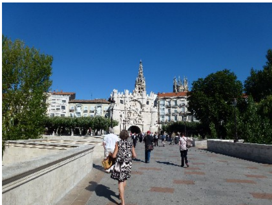
Entrée de la vieille ville