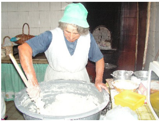
Préparation de la pâte à pain