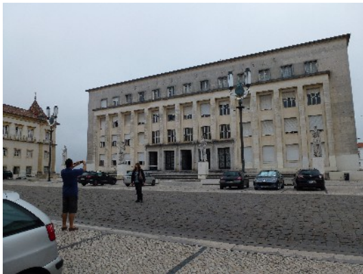
L'université (bat. extérieur)

25 000 étudiants fréquentent cette Université. Comme cette forteresse était un palais, nous trouvons au sous sol une prison. La chapelle St-Michel, implantée également dans l'université, est réservée au recteur, aux professeurs et aux étudiants qui souhaiteraient s'y marier (ou bien pour leurs obsèques). Des concerts y sont également donnés.