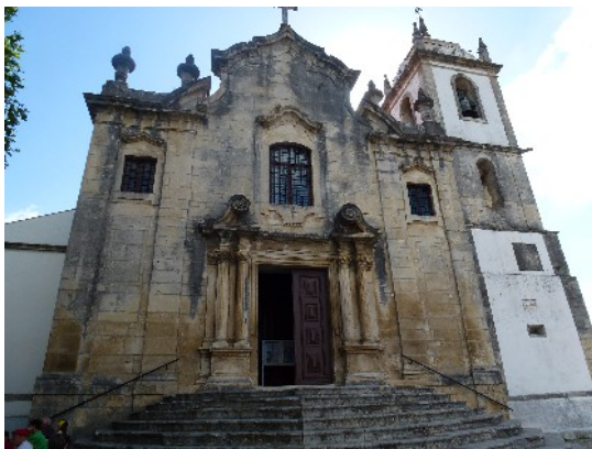
Eglise Notre Dame

Rendez vous à 10 H sur la place du village et visite de la cité de « pierre et d'eau » : Eglise Notre Dame, vieilles rues aux superbes façades, musée ethnographique, piscine, Chapelle du Seigneur « de la Fontaine », Chapelle du St Esprit... Roger, notre guide, est un passionné.