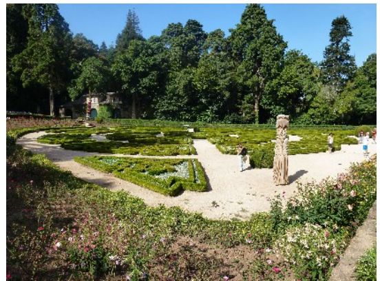
Palais de Mato do Bussaco et son parc

Pour d'autres, ce sera la visite d'autres pâtisseries de la ville qui préparent pour le dimanche les gâteaux aux œufs, typiques d'Ançà, très réputés.