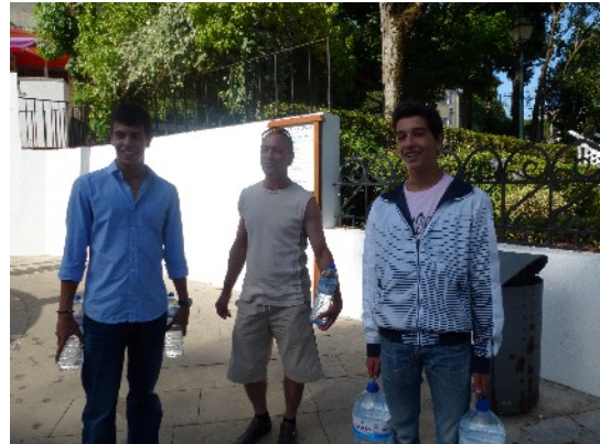
Les Thermes de Luso et remplissage des bouteilles avec l'une des familles