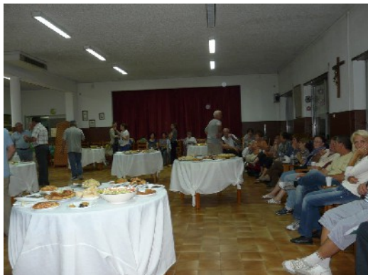
Repas commun à Ançà