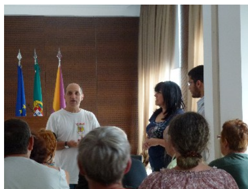
Arrivée à Cantanhede