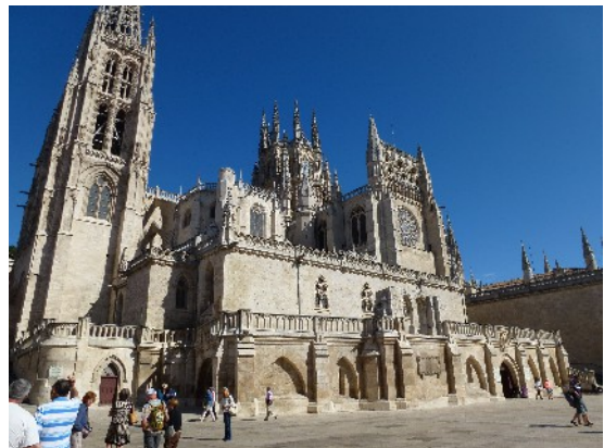
Cathédrale de Burgos